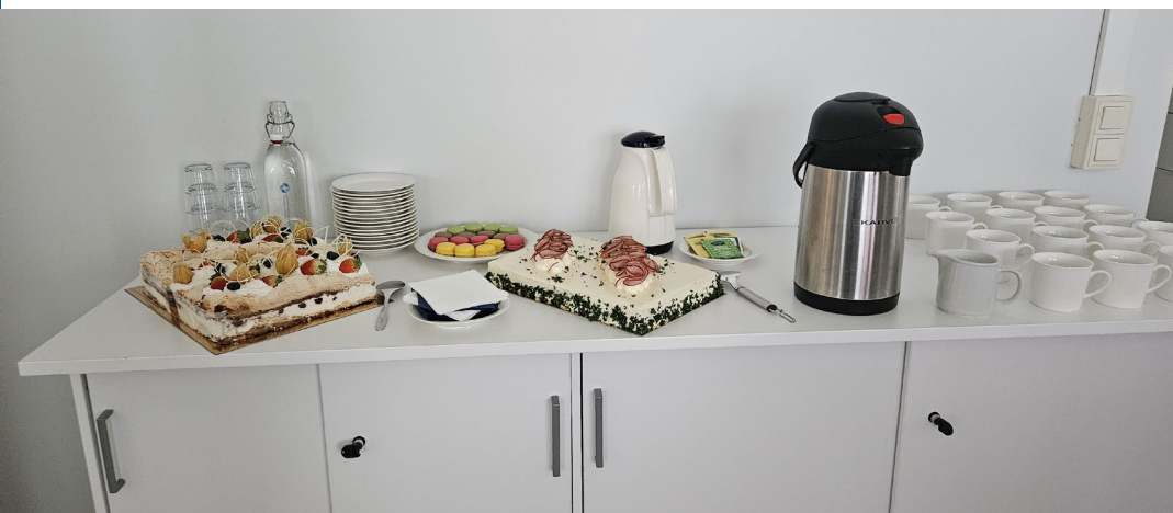
Käyttöpäällikkö Teemu Järvinen täytti 50-vuotta.