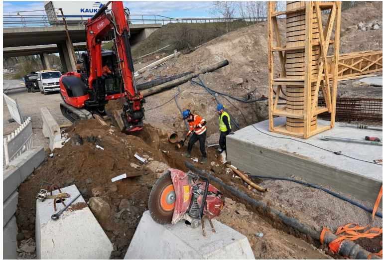
Kuvat Keravan siltatyömaan putken korjauksesta