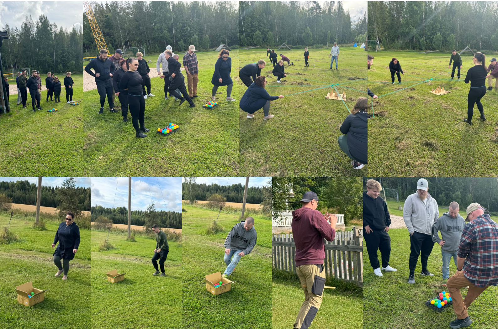
Henkilökunnan virkistyspäivillä testattiin yhteistyötaitoja monissa eri lajeissa.