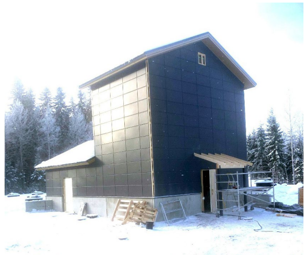
Santakosken vedenottamo hanke