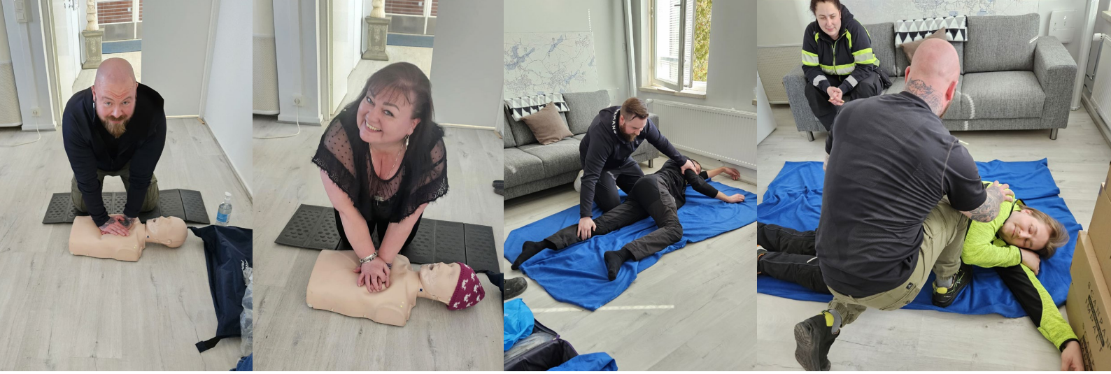
Turvallisuus ennen kaikkea! Henkilökuntaa hätäensiapukurssilla elokuussa.