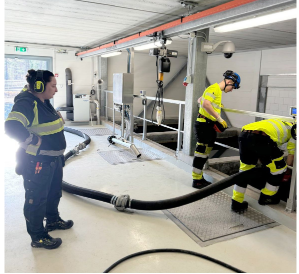
Harjoittelijat työntouhussa Tanjan valvoessa työnlaatua