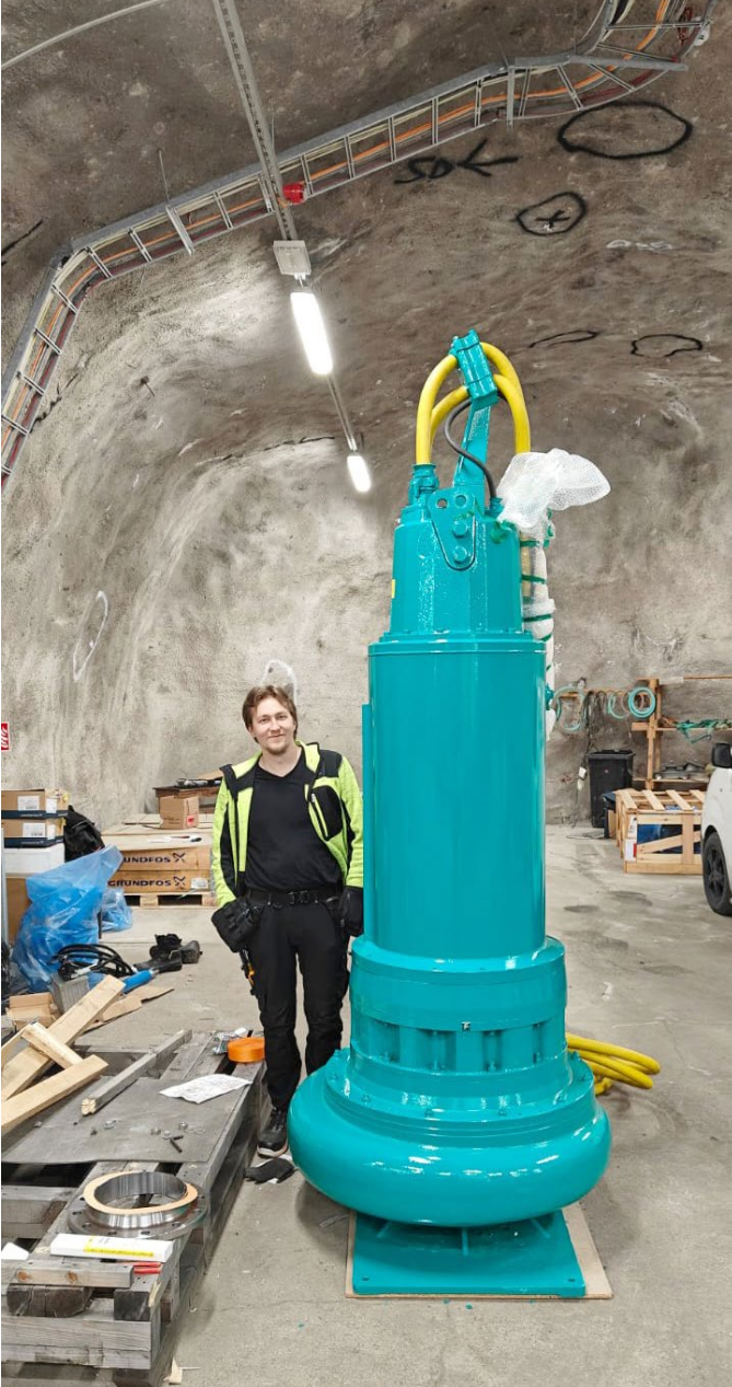
Aleksanteri ja Wilon pumppu Pihlajamäki